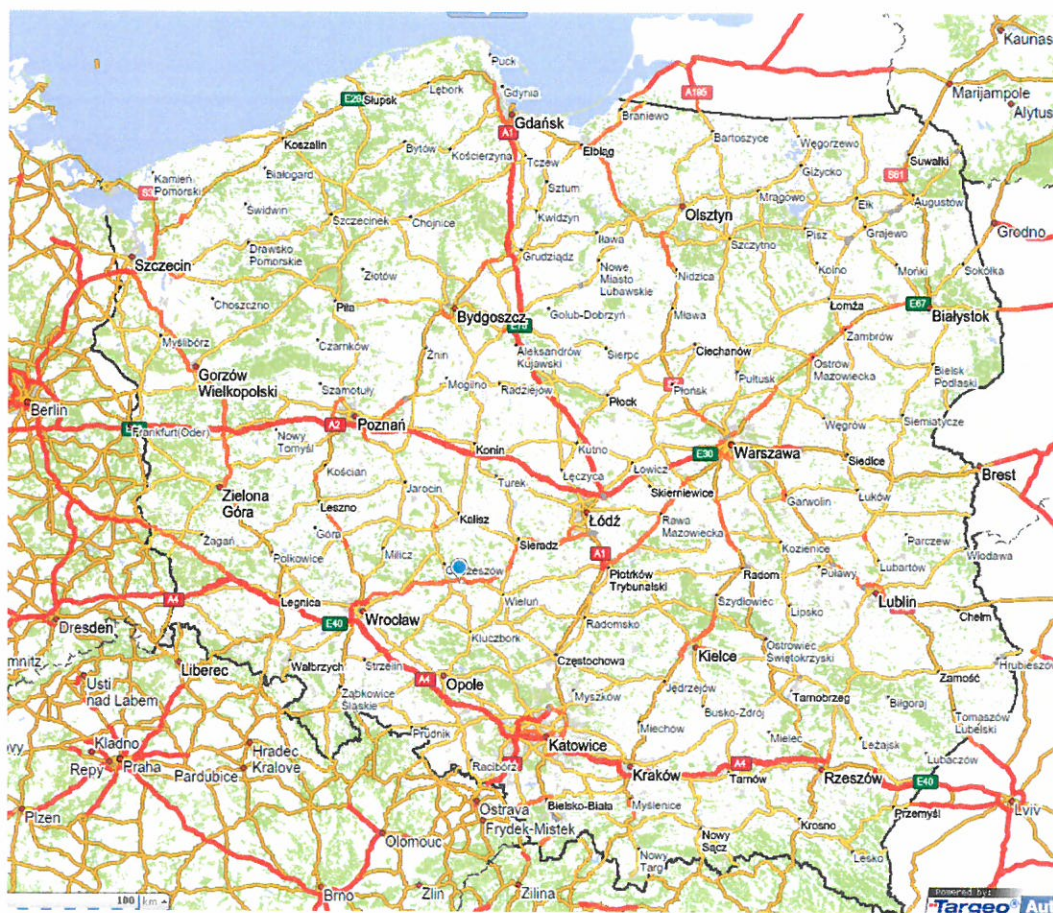
Mapa 1 Lokalizacja miejscowości Świba na mapie Polski

Wschodnia granica sołectwa Świba jest jednocześnie granicą województw wielkopolskiego i łódzkiego oraz zachodnią miasta Wieruszów. W latach 1975-1998 miejscowość administracyjnie należała do województwa kaliskiego.