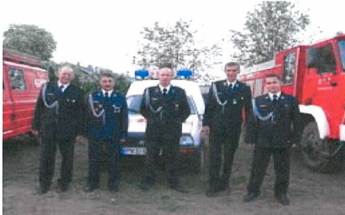
Członkowie OSP Świba