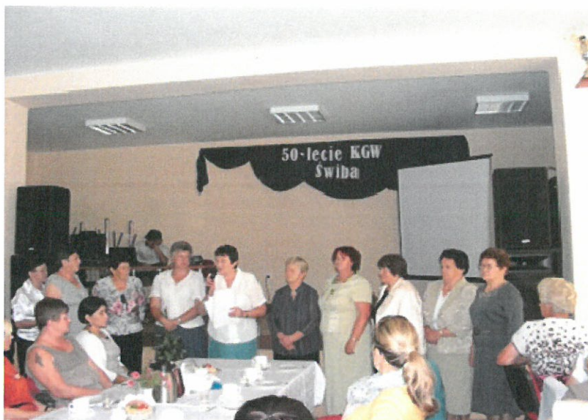
Podczas uroczystości z okazji 50-lecia KGW Świba