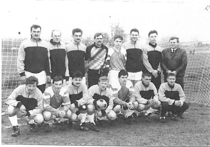
Drużyna :LZS „Sokół” Świba