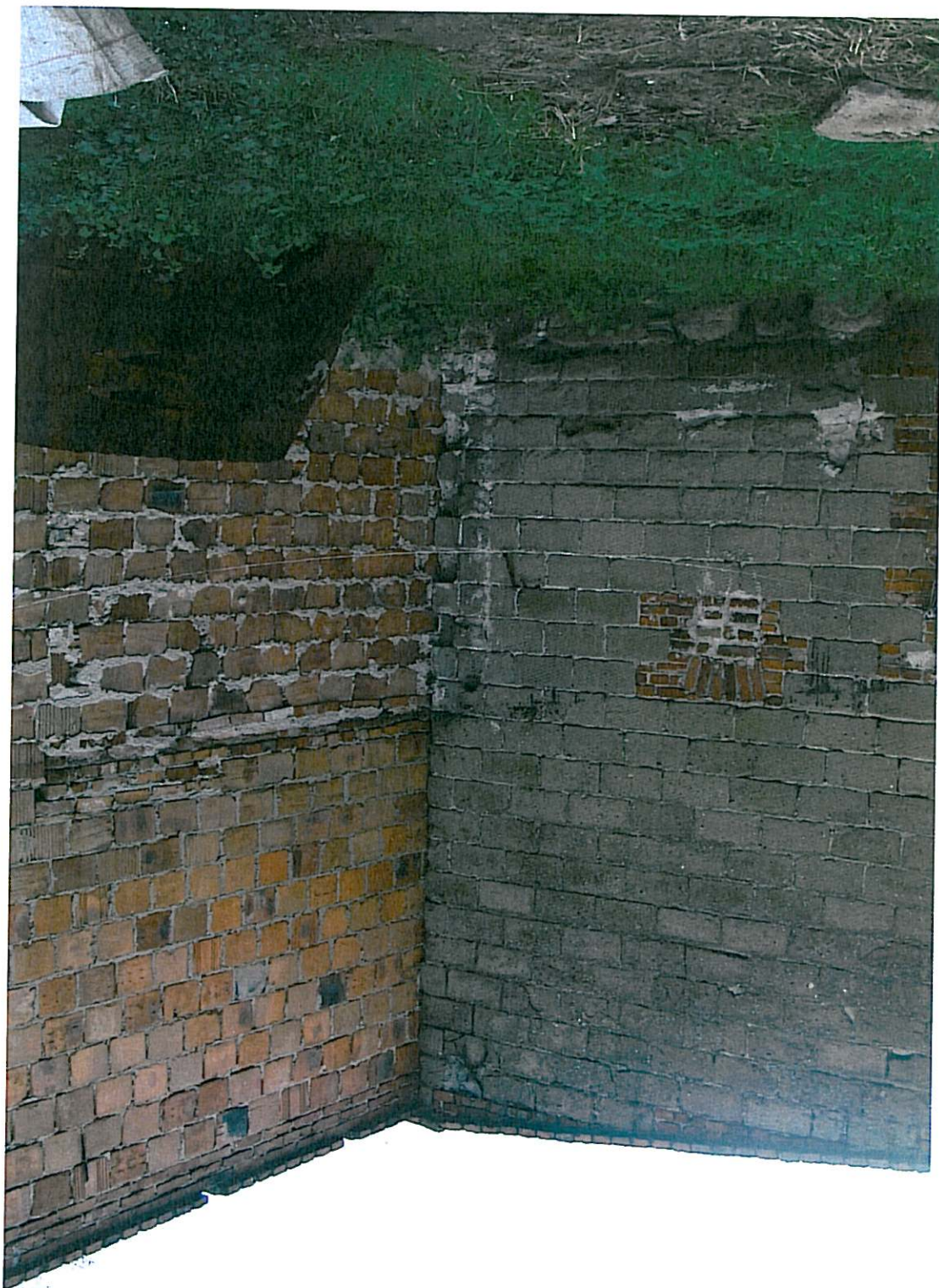
BUDYNEK DO ROZBIÓRKI