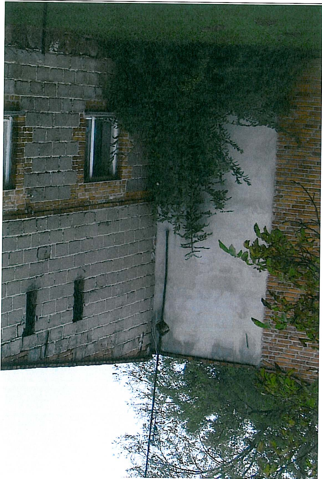
BUDYNEK DO ROZBIÓRKI