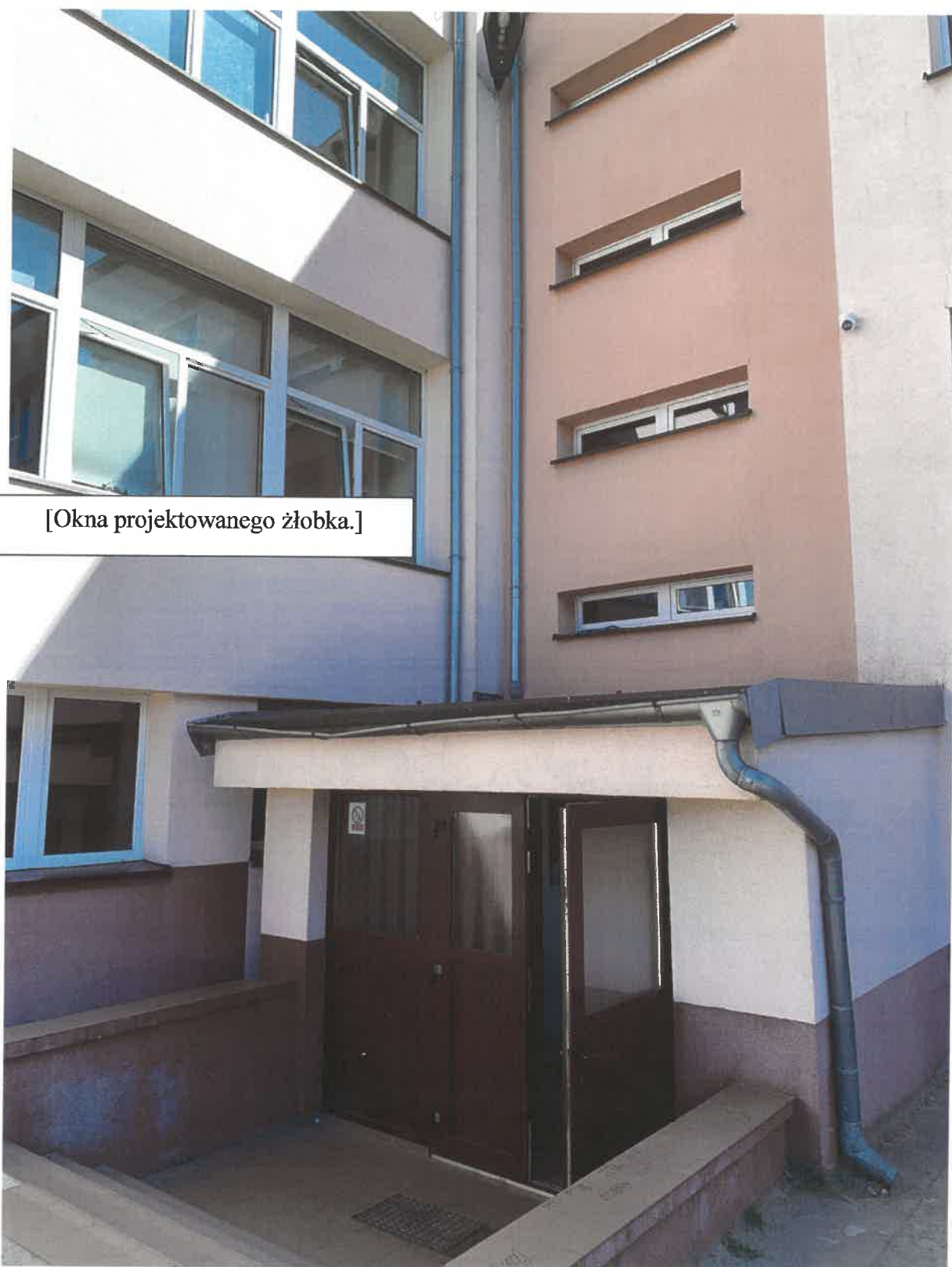
Sąsiedztwo ściany zewnętrznej projektowanego żłobka i ściany zewnętrznej klatki schodowej w szkole.