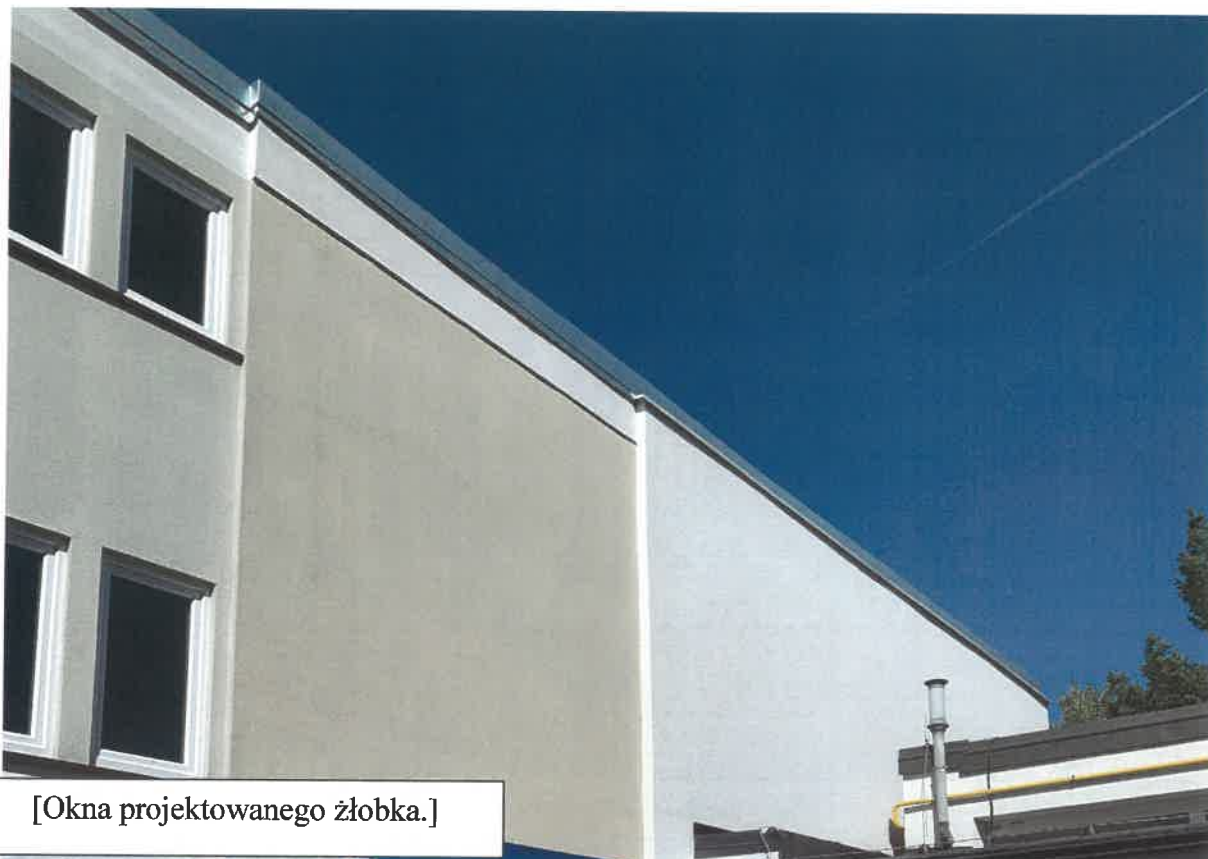
[Okna projektowanego żłobka.]