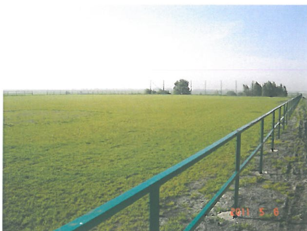
zdjęcie 5 boisko sportowe