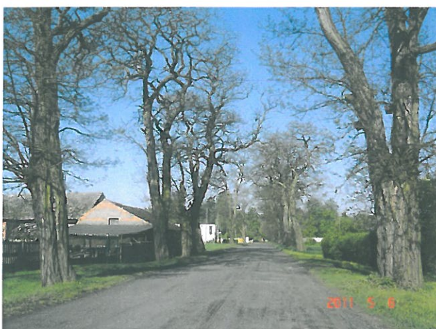
zdjęcie 8 aleja akacjowa