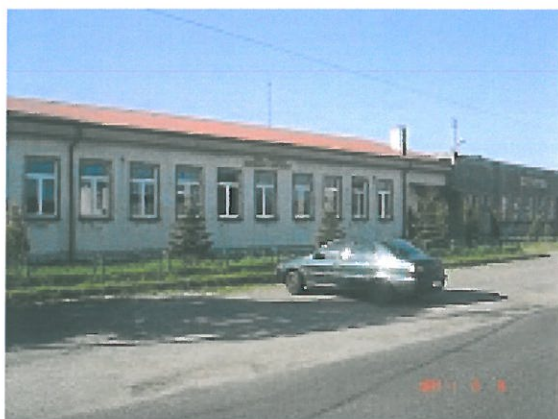
zdjęcie 2 dom ludowy