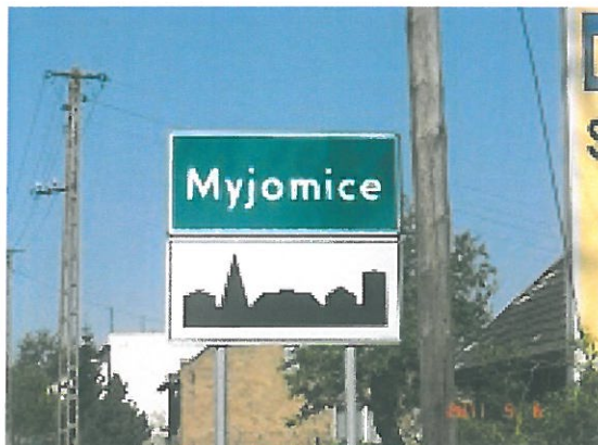
zdjęcie 1 nazwa miejscowości