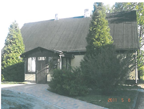
zdjęcie 6 stara plebania