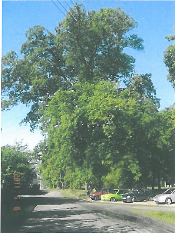
zdjęcie 10 wiaz