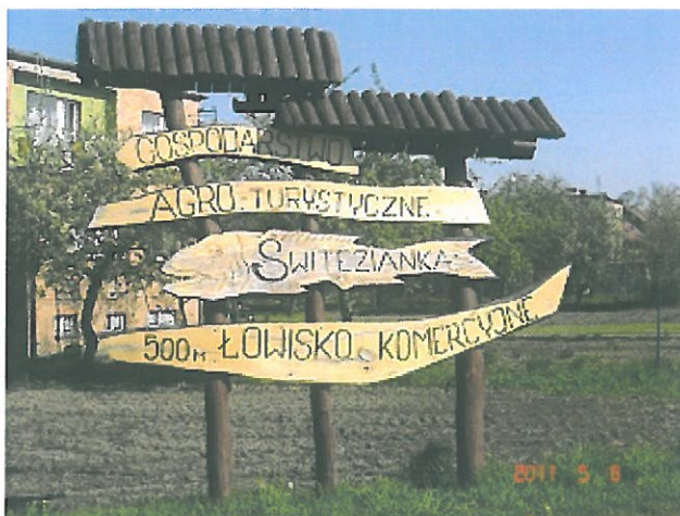
zdjęcie 11 miejscowy informator