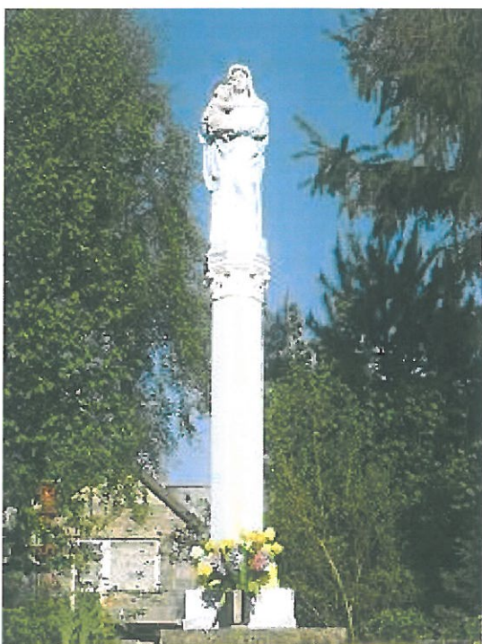
zdjęcie 13 obelisk