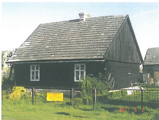
zdjęcie 3 ostatnia drewniana chata