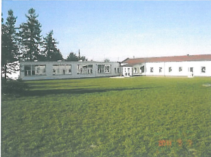
zdjęcie 14 szkoła podstawowa