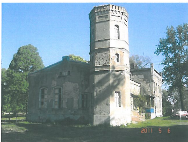
zdjęcie 9 Dwór mur.1864r