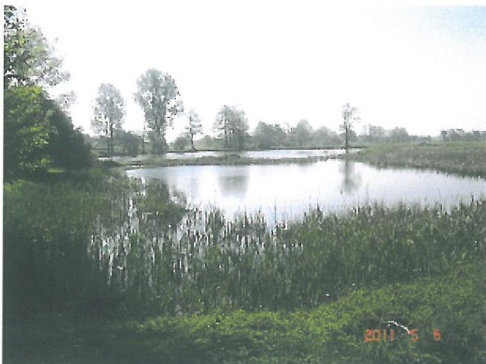
zdjęcie 12 stawy myjomickie