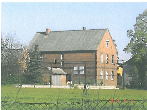
zdjęcie 4 stara szkoła podstawowa