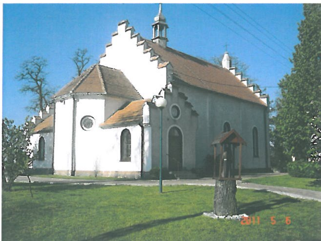
zdjęcie 7 kościół parafialny