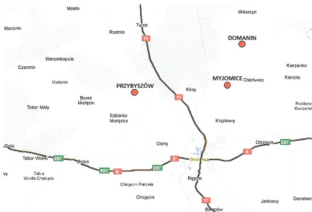
Mapa 2. Lokalizacja miejscowości Domanin względem sieci drogowej