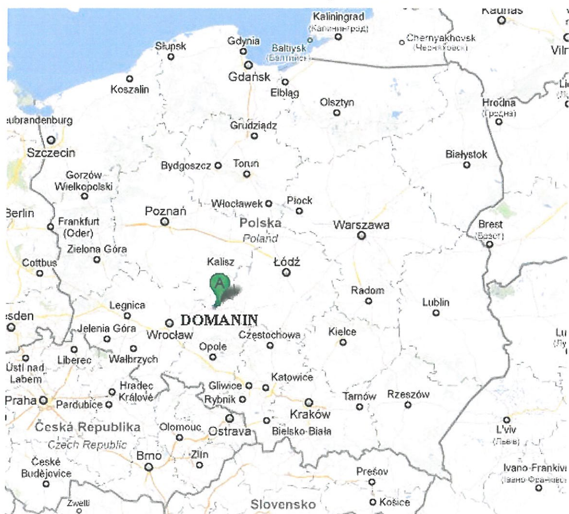
Mapa 1. Lokalizacja miejscowości Domanin na mapie Polski

Jest to wieś położona w południowej części województwa wielkopolskiego, w powiecie kępińskim, w północnej części gminy Kępno. Domanin leży przy drodze powiatowej Kępno-Doruchów, ok. 11 km na północ od Kępna. Od dużych aglomeracji miejskich takich jak Wrocław dzieli go ok. 85 km, od Kalisza ok. 56 km i ok. 81 km od Opola, od Poznania odległość ta wynosi ok. 170 km.