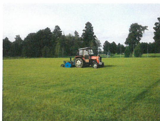
Boisko do piłki nożnej i korty tenisowe w Krążkowach

8. Opis i charakterystyka obszarów o szczególnym znaczeniu dla zaspokojenia potrzeb mieszkańców, sprzyjających nawiązywaniu kontaktów społecznych ze względu na ich położenie oraz cechy funkcjonalno-przestrzenne, w szczególności poprzez odnawianie lub budowę placów parkingowych, chodników oraz oświetlenia ulicznego.