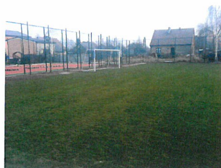
Boisko do piłki nożnej i kort tenisowy w Hanulinie