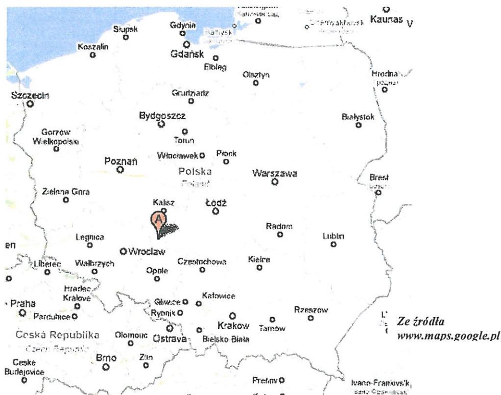
Mapa 1. Lokalizacja miejscowości Borek Mielęcki na mapie Polski.

Przez wieś przebiega droga powiatowa łącząca Kępno z miejscowościami gminy Bralin i Kobyla Góra.